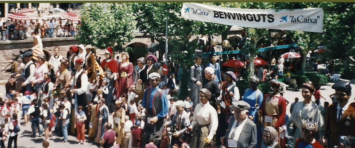
Trobada intercomarcal de l'any 2003 a Cardona.

Les trobades de gegants Bages-Berguedà, són unes festes geganteres periòdiques que se celebren anualment en un municipi diferent d'aquestes dues comarques. Els inicis d'aquesta festa els hem de buscar a la dècada dels 90, quan l'Agrupació de Colles de Geganters ja estava força consolidada i, progressivament, s'anava escampant arreu del territori català, creant les coordinadores geganteres, conegudes també com a vocalies, seccions organitzatives que tenen la finalitat d'ajudar a coordinar el funcionament de les diferents colles geganteres agrupades. Així, en aquest context, cap a l'any 1995, es crea la vocalia Bages-Berguedà que serà l'encarregada d'organitzar les primeres trobades geganteres en aquestes dues comarques. Cal dir que les trobades geganteres són festes que podem qualificar de relativament modernes, que reuneixen més d'una vintena de colles i que mouen al voltant d'unes 700 persones. Tot va començar l'any 1996, quan Avinyó va acollir la primera Trobada de Gegants Bages-Berguedà, esdeveniment que marcaria un abans i un després en les festes geganteres de la vocalia.