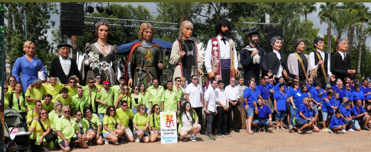
Proclamació de la XVI Fira del Món Geganter de Catalunya a Balsareny. La Ràpita (Montsià), setembre de 2023.

Una de les propostes, i particularitat d'aquesta candidatura que presentem, ja traslladades des d'un bon inici, és fer créixer l'efemèride en qüestió i el diumenge dia 16 de juny fer coincidir la passejada tradicional de la Fira amb la XXIV Comarcal Bages - Berguedà . Un cop consensuada i valorada la viabilitat d'aquesta proposta amb els corresponents responsables d'ambdues celebracions, creiem que la festivitat es pot veure encara més reeixida, amb una major participació de colles i rebent molta més afluència de públic als diferents actes previstos, aconseguint un major ressò general d'aquest esdeveniment.